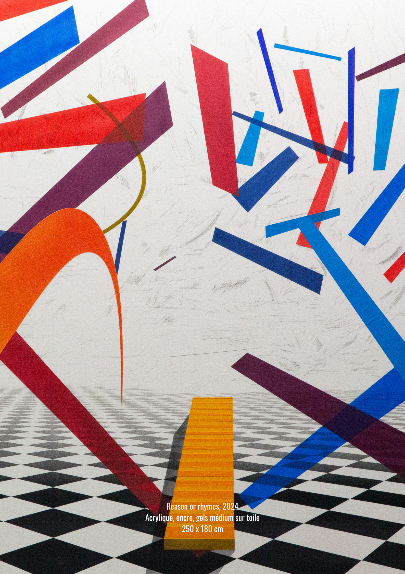
Reason or rhymes, 2024 Acrylique, encre, gels médium sur toile 250 x 180 cm