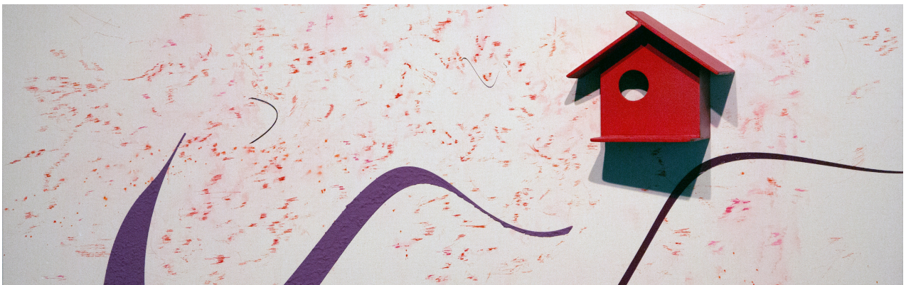
The migration of the swallows, 2024, acrylique, encre, gels médium, sur toile, 180 x 125 cm