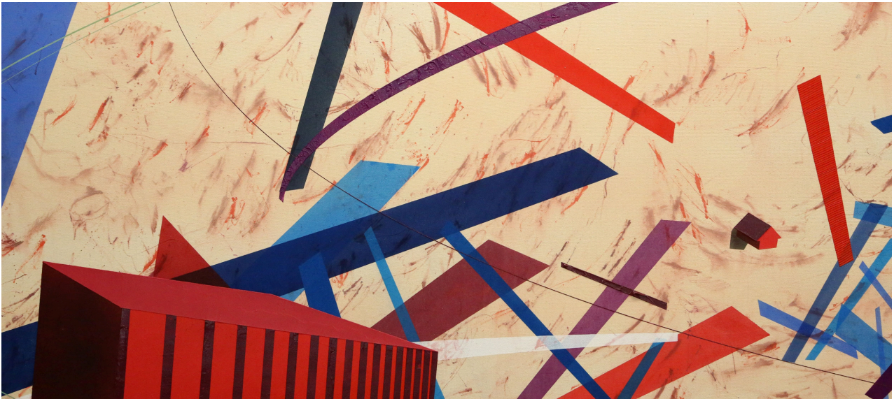
Conflicts in the parliament, 2024, acrylique, encre, gels médium sur toile 250 x 180 cm

À travers une géométrie fragmentée et des espaces volontairement déséquilibrés, Ciccone interroge ce qu'il subsiste du foyer lorsque les repères vacillent et que l'identité se reconstruit dans l'entre-deux.